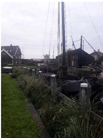
De Rot aan het remmingswerk bij de sluis in Workum

Het wordt een tochtje in de regen maar weinig wind en een redelijke temperatuur. Bij de spoorbrug moeten we even wachten. Na de spoorbrug ligt de lemmeraak van de schipper zijn petekind. Maar helaas, niemand aan boord. Dus varen we door naar de sluis, waar we net buiten de museumhaven aan het remmingswerk aanleggen om ca 15.30 uur. Morgen het schip verhalen, als de botter die daar "op ons plekje" ligt is verhaald.