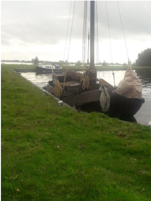
Voor de wal op de Langehoekspuolle

We hebben vandaag geluk gehad. Helaas geen goede wind om te zeilen, maar nadat we vertrokken stopte de motregen en zijn we droog naar Gaastmeer gevaren. We hebben zelfs nog genoten van de ondergaande zon die tussen de wolken door piepte.