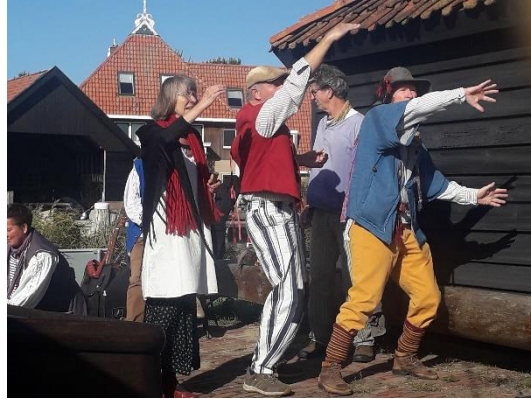
Muziek van de groep Pekel in de Nije Klameare Onstuimig Schuim optreden naast de Rot