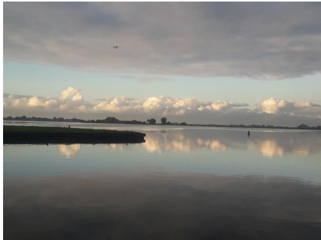
Mooie luchten richting Gaastmeer

Op vrijdagmorgen wordt eerst de afwas gedaan, worden de telefoonproblemen met het toestel van Klaus opgelost, praten we bij onder het genot van een bakje koffie en varen we ca 13.30 uur richting Workum. Daarvoor hebben we de Rot helemaal spik en span geschrobt om netjes in Workum te verschijnen.